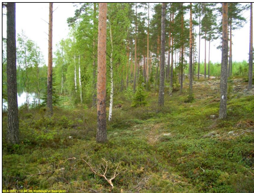
Saarijärven itärantaa kuvattuna pohjoiseen.