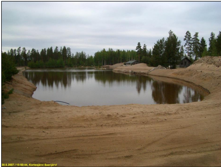
Länsirannan maisemoitua vanhaa hiekkakuoppaa. Kuvattu pohjoiseen.