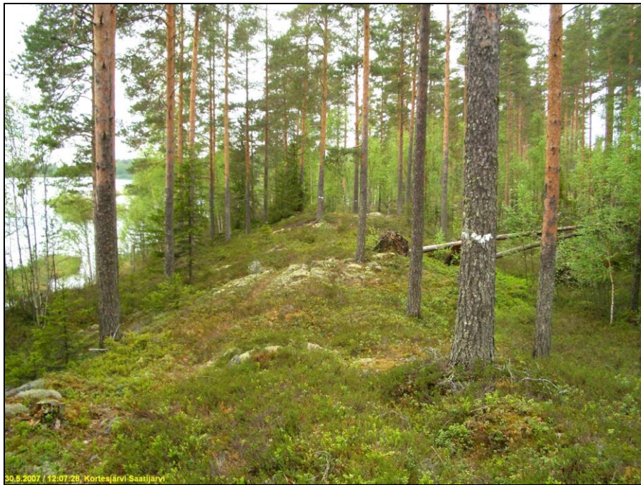
Itärannan keskiosan rannan "punkaa" – kapeaa moreeniharjannetta.