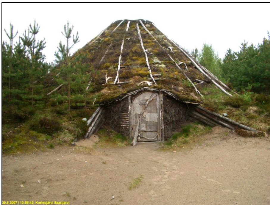
Kivikautisen asumuksen rekonstruktio Saarijärven länsirannan tuntumassa.