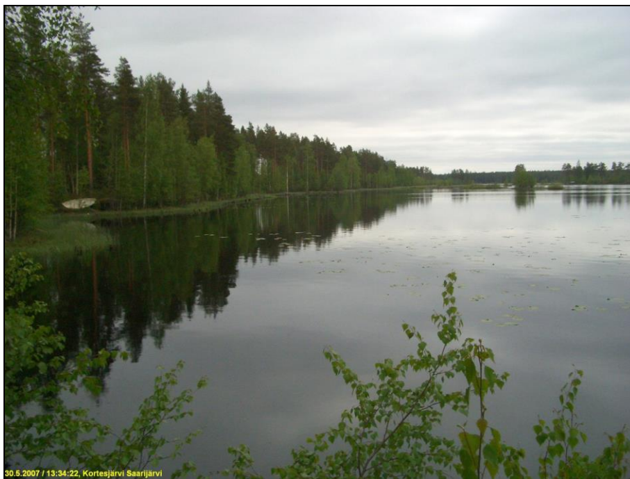
Itärantaa kuvattuna tutkimusalueen pohjoispäästä etelään.